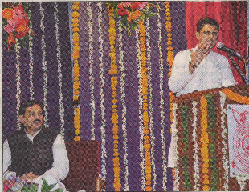
Minister Sachin Pilot addressing a meet in the city on Saturday

Pilot launched 3G services in Porbandar, Diu, Gondal, Moti Khavdi, Panoli GIDC, Vyara and Waghodiya from Vadodara through video conferencing in the presence of Union minister of state for power Bharat Solanki and Union minister of state for tribal affairs Dr Tushar Chaudhary, who participated by a video link from Bardoli. He also launched 3G coverage on Ahmedabad-Mumbai (up to Vapi) national and Ex-